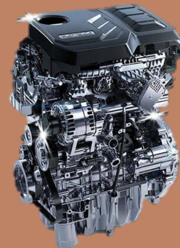
اکستریم وی اکس ۲ لیتری توربو

اکستریم VX دارای یک موتور ۲ لیتری چهار سیلندر توربو با سیستم تزریق مستقیم سوخت بوده که قادر به تولید ۲۶۱ اسب بخار قدرت و ۴۰۰ نیوتن متر گشتاور است. نیروی تولیدی توسط گیربکس اتوماتیک ۸ سرعته ساخت آیسین به صورت AWD به هر چهار چرخ منتقل می شود. این خودرو در هر ۱۰۰ کیلومتر سوخت ترکیبی حدود ۹ لیتر بنزین مصرف می کند. وزن خالص VX حدود ۱۹۲۰ کیلوگرم بوده که ۵۰۰ کیلوگرم سبکتر از لندکروزر بوده که این موضوع عملکرد بهتری را برای این خودرو رقم می زند. اکستریم VX قادر است طی ۹.۷ ثانیه از حالت سکون به مرز ۱۰۰ کیلومتر بر ساعت برسد. اکستریم VX دارای هفت مد رانندگی هوشمند برای سیستم تمام چرخ محرک بوده که بهترین عملکرد را در مسیرهای مختلف را به ارمغان می آورد.