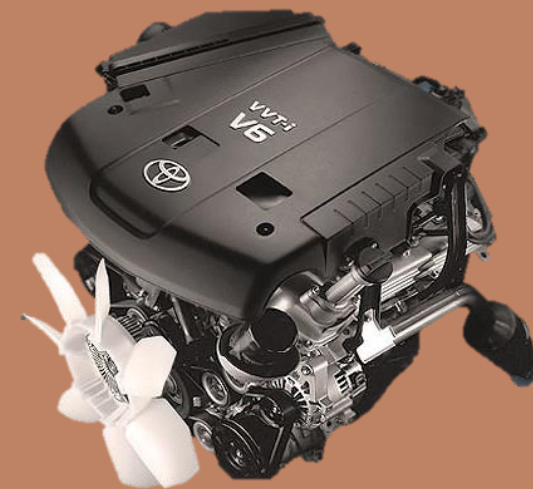
تویوتا لندکروزر ۴ لیتری